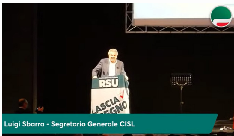
Luigi Sbarra - Segretario Generale CISL